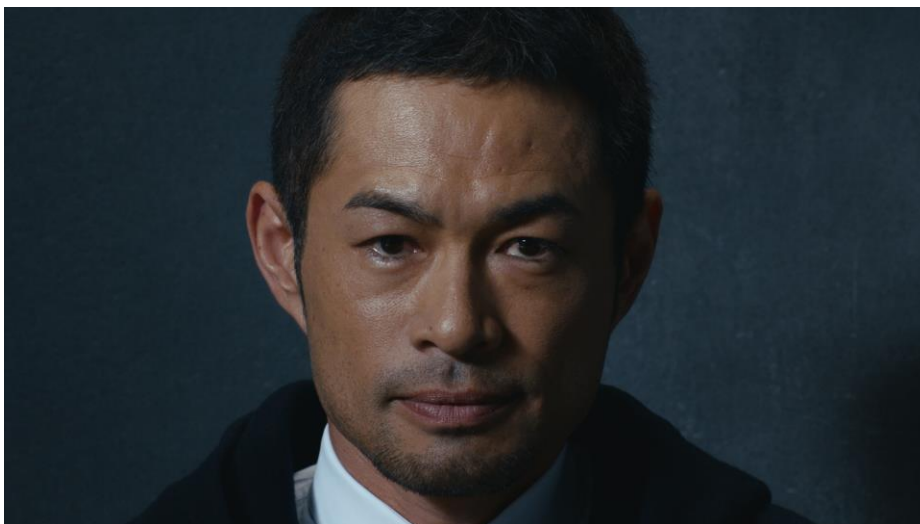
「WOW BEAUTIFUL NAME イチロー」篇より

2017年の幕開けにあたり、当プロジェクトのメッセージを伝えるTVCMを、2017年1月1日（日）から 全国で放映します。昨年に引き続き、イチロー選手とリオ2016パラリンピック日本代表（水泳）・一ノ瀬 メイ選手にご出演いただくほか、日本身体障がい者水泳連盟会長・河合純一さん、地域で交通安全活動に 取り組む交通指導員、宮城県の「トヨタ自動車東日本」でクルマ作りに取り組む青年たちを起用した5篇を、 「ニューイヤー駅伝」（1月1日（日）/TBS系列）と「第93回東京箱根間往復大学駅伝競走」（1月2日～3日 /日本テレビ系列）において放映いたします。