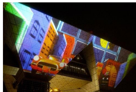
「東京国際プロジェクションマッピングアワード Vol.6」 東京ビッグサイト前広場

【本件に関するお問い合わせ先】 千葉商科大学 学部事務課 TEL: 047-382-5205 / E-mail: office-gkb@cuc.ac.jp