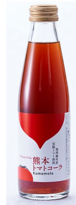
「熊本トマトコーラ」 (熊本) 200ml

インスタグラムでヒットした果実のフレーバーを使用し、ネーミング・パッケージともにお洒落仕に上げた炭酸飲料シリーズです。創業以来の商品でもあるラムネの容器を採用しつつ、デザイン性にもこだわり抜いた商品です。