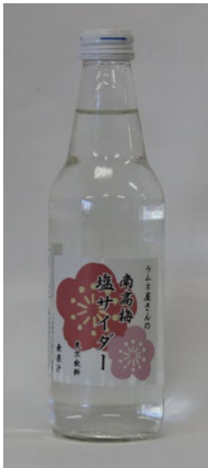
「南高梅塩サイダー」 (東京) 340ml

中野でおよそ80年以上ラムネを作り続けている「東京飲料」の職人達が心をこめて作ったサイダー、昭和の味です。