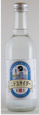
「ニテコサイダー」 (秋田) 300ml

「水」にこだわり、「水」本来のうまさを引き出すため、柔らかな甘さと、まろやかな炭酸に仕上げています。スッキリと爽やかで、口の中に優しく広がる甘さは、100年以上も守り継がれた伝統のサイダーです。