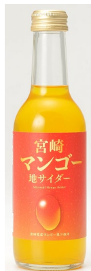
「宮崎マンゴーサイダー」 (宮崎) 245ml

芳醇な香りとジューシーで柔らかい黄色の果肉が特徴の高級果物「宮崎マンゴー」。 希少価値の高い宮崎県産のマンゴー果汁を贅沢に使用した宮崎の地サイダーの誕生です。マンゴーのまろやかな甘さと、サイダーの刺激を合わせた一品です。