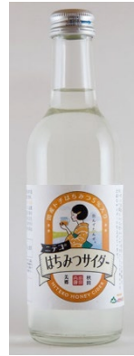
「はちみつサイダー」 (秋田) 300ml

ほのかに香るりんごの甘酸っぱさ風味がさわやかな炭酸と重なって、とってもフルーティーなサイダーに仕上げています。