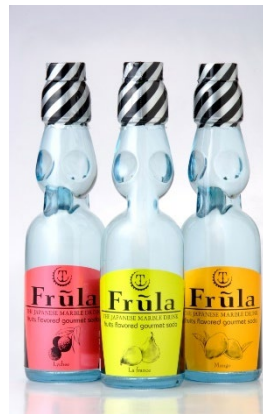
「フルーラ ラ・フランス/ライチ/マンゴー」 (佐賀) 200ml

大正3年生まれのサイダー。発売当初より製造方法は、ほとんど変えていません。天然レモンの香料を使用し、人工甘味料を使わず、砂糖を使用することにより、爽やかな甘さと後味の良いサイダーに仕上がっています。