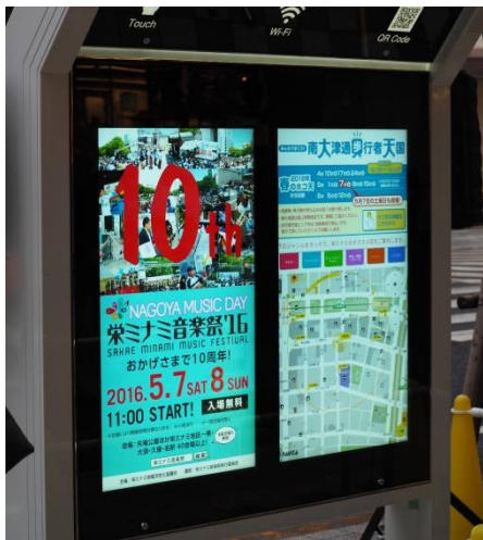
【広告(左)と周辺地図等(右)が併設されたディスプレイ】