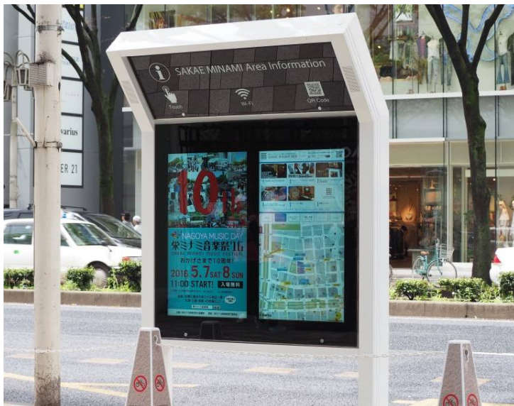
【名古屋の中心地、栄ミナミ地区に設置されたデジタルサイネージ】

～ 地元主体の社会実験で、地上歩道部への広告付きデジタルサイネージ設置は日本初！ ～