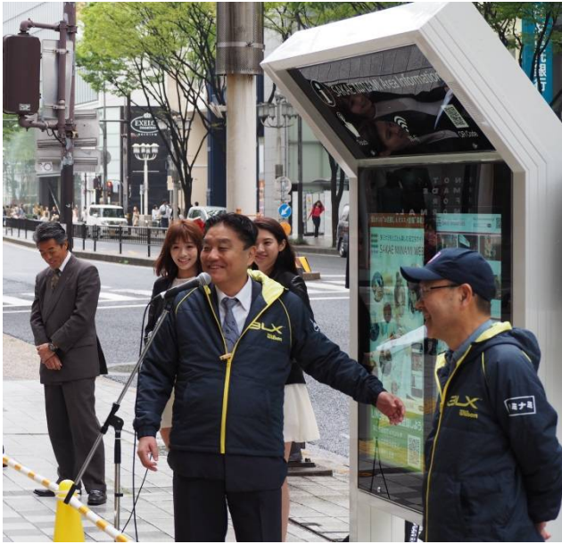
【オープニングセレモニーに出席された河村たかし名古屋市長】