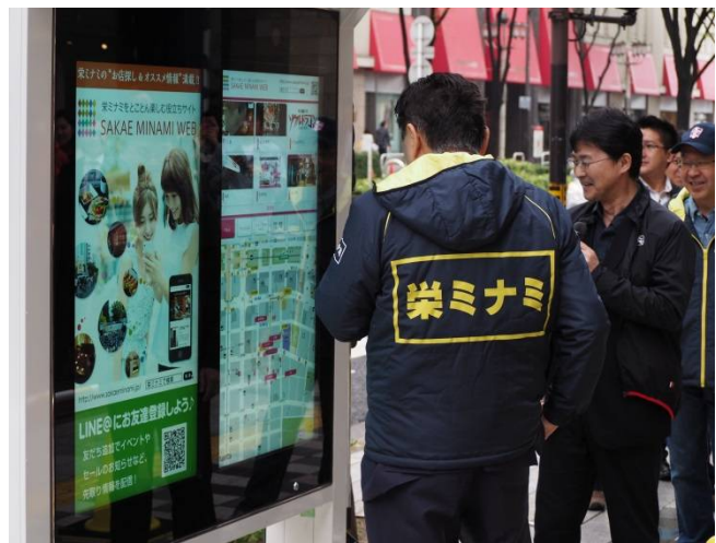
【河村たかし名古屋市長もタッチパネルを実際に体験】