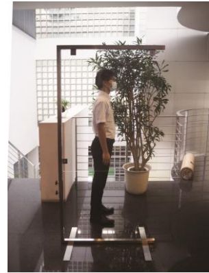
○講義や授業、 会議場や展示場で