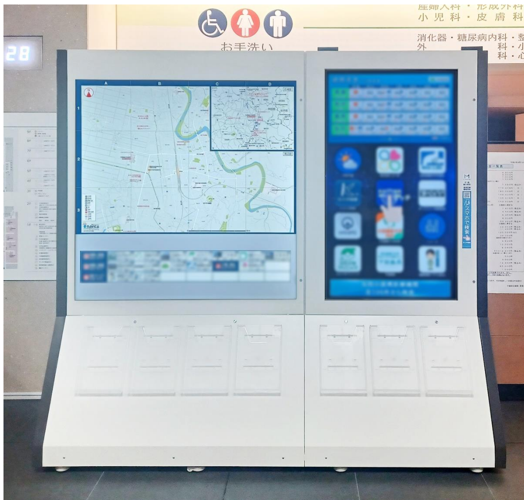
<メディカルナビタメインビジュアル>

当社の「メディカルナビタ」は搭載案内サービスをオーダーメイド感覚で選定でき、設置場所に適したサービスを展開することが可能です。