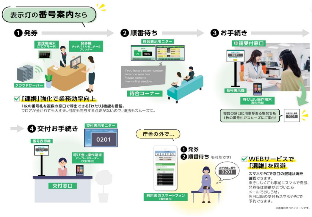
<表示灯の番号案内の流れ>