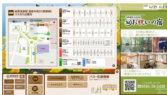
(バス・交通情報 表示例)