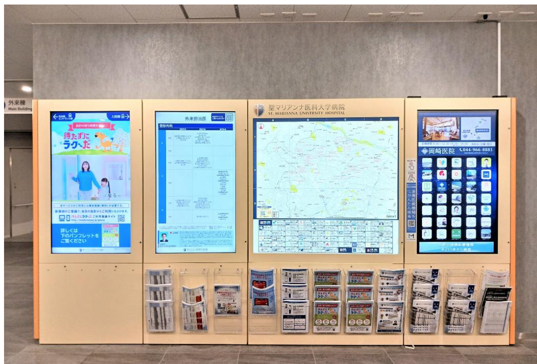
<メディカルナビタメイン ビジュアル>