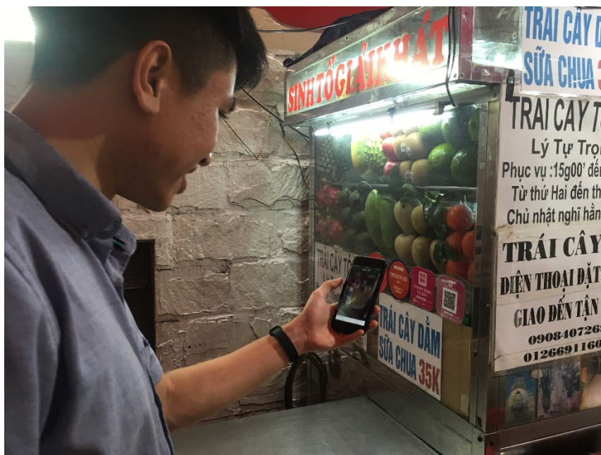
MoMo は屋台にも加盟店を拡大中

ユーザー数が最も多い MoMo は、2018 年内にアカウントが 1,000 万件を超える見通しです。