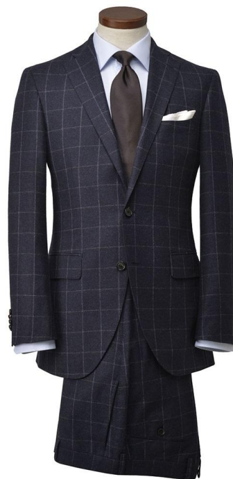
「カルロ・バルベラ」スーツ画像

その後、あえて旧織り機のようなゆっくりとしたスピードで生地を織り上げ、大量生産の生地にはない、空気を含んだふくらみのある生地に仕上げられています。