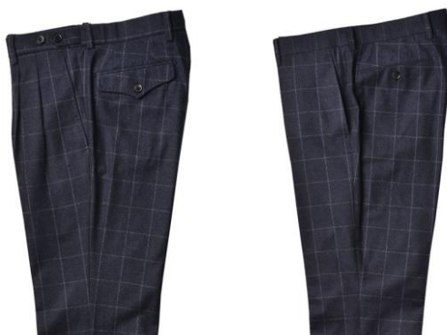
(ツーパンツスーツ生地:5種類)

* デザインが異なるスペアパンツ仕様。 今もっともトレンド性のあるデザインのパンツです。 ツータックパンツは単品使用として休日にも着用が 可能です。