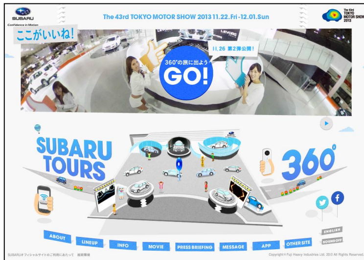
【サイトトップイメージ】