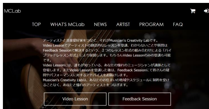
WHAT' s MCLab の画面