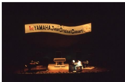
1972年 第1回 JOC 開催(三重県・合歓の郷)