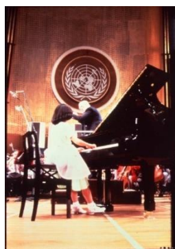
1981年 第1回国際・オリジナル・コンサート開催(ニューヨーク国連総会議場)