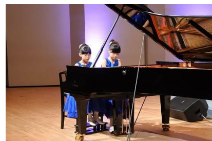
2016年 ヤマハ・ハイライト・コンサート開催(全国7エリア)