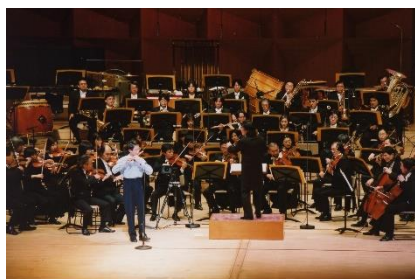
2001年 JOC30周年記念コンサート開催(東京・文京シビックホール)