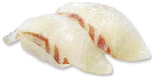
厚切り桜鯛 (税込 216 円) 販売期間:4 月 12 日~25 日