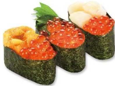
贅沢大粒いくら三種盛り (税込 216 円) 販売期間:4 月 12 日~25 日