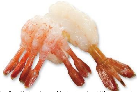
山盛り甘えび&ぼたんえび (税込 216 円) 販売期間:4 月 12 日~14 日