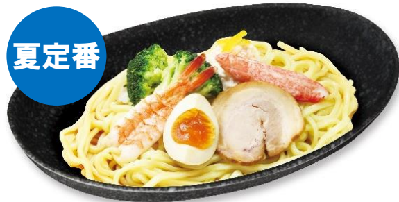
【7種の魚介だれ 冷やし中華はじめました】 (税込 410 円)