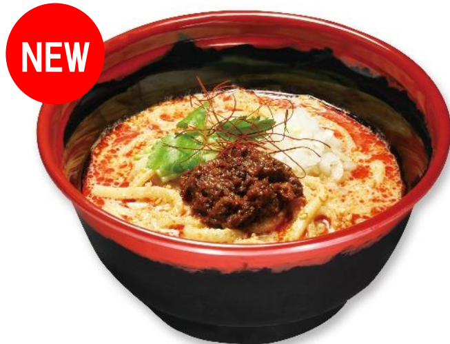
【本格！！冷やし担々麺】 (税込 410 円)

また、4月12日(金)より、くら寿司自慢の「麺シリーズ」も販売開始！毎年大好評を頂いている夏限定メニュー「冷やし中華はじめました」「すしやのシャリカレーうどん」が販売開始。さらに担々麺を冷静スープで楽しむ！新商品「本格！！冷やし担々麺」が夏季限定メニューに仲間入り。お寿司も本格麺メニューも、くら寿司でご堪能ください！