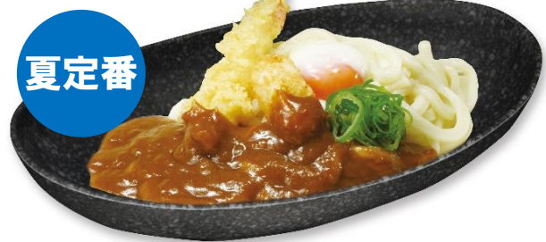
【すしやのシャリカレーうどん】 (税込 410 円)