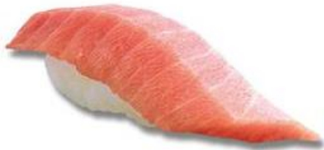
厚切り中とろ(一貫) (税込 216 円) 販売期間:4 月 12 日~25 日