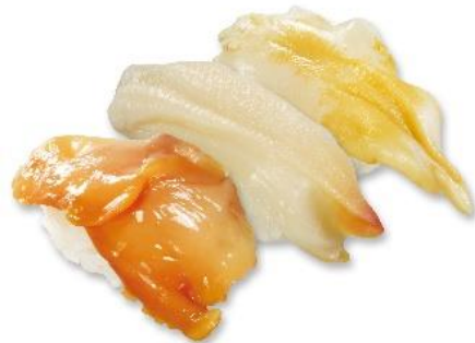
豪華貝三種盛り (税込 216 円) 販売期間:4 月 12 日~18 日