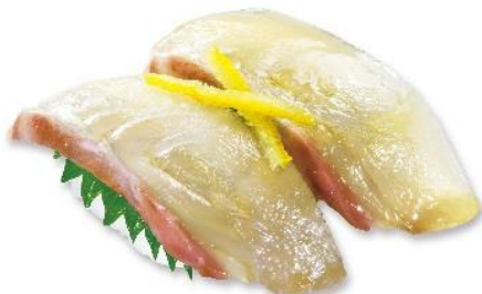
柚子漬け 天然ひらめ (税込 216 円) 販売期間:4 月 12 日~18 日