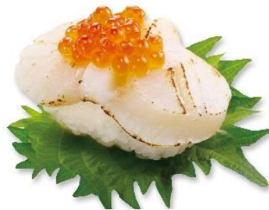
あぶり大粒ほたていくら添え (税込 216 円) 販売期間:4 月 19 日~25 日