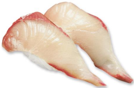
厚切りはまち (税込 216 円) 販売期間:4 月 19 日~25 日