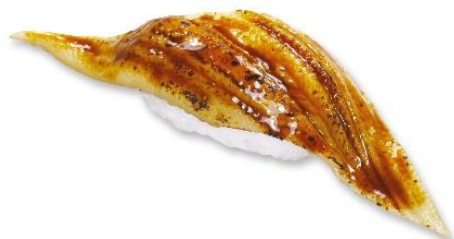
あぶりとろけるあなご (税込 216 円) 販売期間:4 月 12 日~14 日