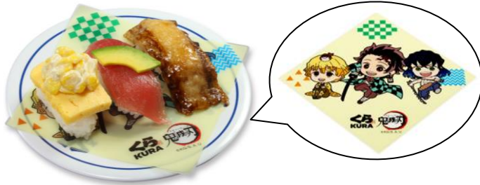
鬼滅の刃にぎり 三種盛り 200円(税込220円)