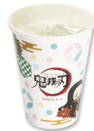
乳酸菌ウォーター 180円(税込198円)

サクサクのコーンに、冷たいアイスと甘酸っぱいベリーソースが相性抜群! キュートな禰豆子のイメージにぴったりなデザートです。