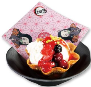
禰豆子のたっぷりベリーアイス 280円(税込308円)

炭治郎を象徴する、市松模様の羽織をイメージしたかまぼこをトッピング。出汁が効いた、くら寿司こだわりのうどんをお楽しみください。