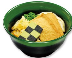
炭治郎のぶっかけうどん 280円(税込308円)

左から、善逸・炭治郎・伊之助をイメージした3種盛り。全て食べ終わると、オリジナルデザインの3人衆が顔を出す楽しい仕掛けになっています。