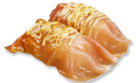
あぶりチーズ生ハム 100 円(税込 110 円)