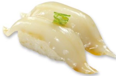
真いか黄身醤油漬け 100 円(税込 110 円)