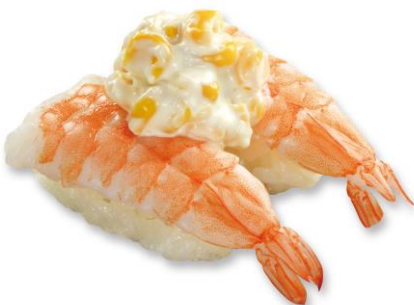
えびコーンマヨ 100 円(税込 110 円)