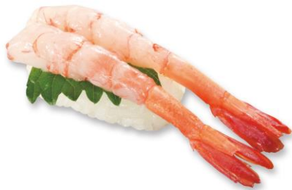
極上大甘えび(一貫) 100 円(税込 110 円)