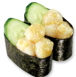
涙小柱 100 円(税込 110 円)