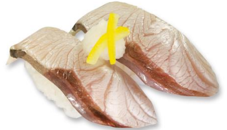
寒ぶり焼きしゃぶ 200 円(税込 220 円)