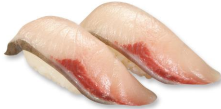
寒ぶり 200 円(税込 220 円)