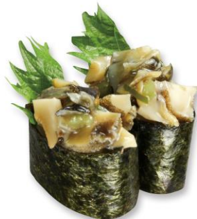
貝わさび 100 円(税込 110 円)