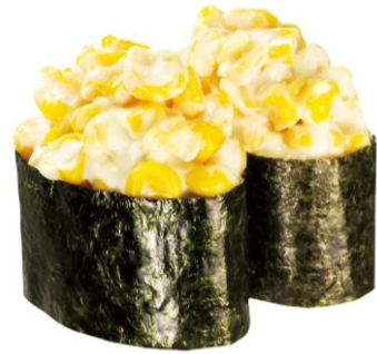
特盛 コーン軍艦 110 円 販売期間:4 月 8 日(金)~4 月 17 日(日)

マグロやハマチなどの海鮮の具に、いくらや黄色とびこなどをトッピングし、宝石のように見立てた見た目も華やかな商品です。