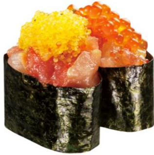
特盛 宝石軍艦 220 円 販売期間:4 月 8 日(金)~4 月 17 日(日)

マグロやハマチなどの海鮮の具に、いくらや黄色とびこなどをトッピングし、宝石のように見立てた見た目も華やかな商品です。