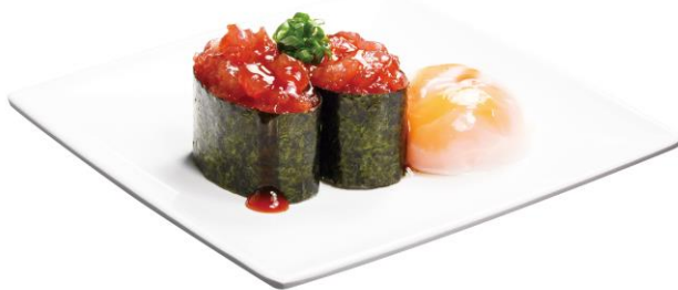
特盛 まぐろユッケ軍艦 220 円 販売期間:4 月 8 日(金)~無くなり次第終了 ※お持ち帰り不可

甘みや旨みを追求し、スイートコーンのスーパースイート種を厳選。通常の 1.5 倍の量を使用した、ボリューム満点の一品です。