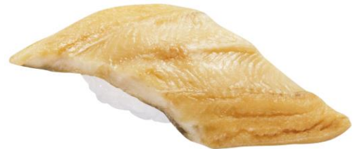
特大切り とろける穴子(一貫) 220 円 販売期間:4 月 8 日(金)~4 月 21 日(木)

マグロの旨味を引き立たせる、特製のユッケだれを使用。トッピングした温玉と混ぜ合わせることで、とろとした味わいをお楽しみいただけます。