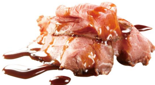
特製たれ使用 特盛ローストビーフ 220 円 販売期間:4 月 8 日(金)~無くなり次第終了 ※お持ち帰り不可

新鮮な穴子のみを厳選。身は柔らかく、口の中でとろけるような食感をお楽しみいただけます。お好みで、甘だれをかけてお召上がりください。