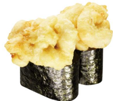
特盛 たら白子天ぷら軍艦 220 円 販売期間:4 月 8 日(金)~無くなり次第終了 ※お持ち帰り不可

赤身と脂身のバランスが良いローストビーフを贅沢に使用した、肉好きにはたまらない一品。甘辛く煮詰めた特製たれが、ローストビーフと相性抜群です。