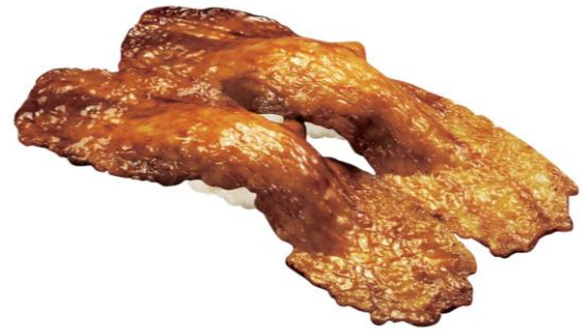
特大切り イベリコ豚大とろ 220 円 販売期間: 4 月 8 日(金)~4 月 17 日(日)

シャリから大きくはみ出るほど特大のエビフライをまるまる一匹使用した迫力満点の商品です。注文が入ってから店内で揚げるため、サクサクの食感をお楽しみいただけます。