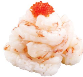
特盛 赤えびにぎり 220 円 販売期間: 4 月 8 日(金)~4 月 17 日(日) ※お持ち帰り不可