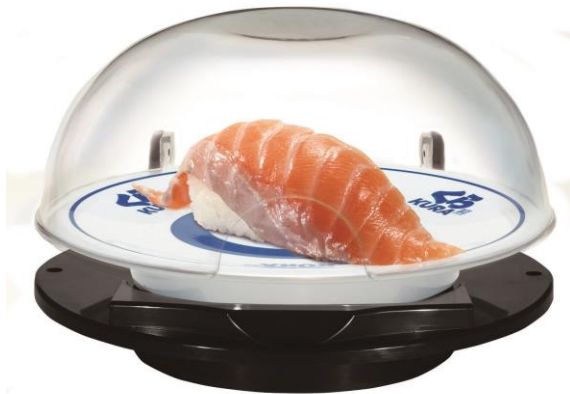
特大切り生サーモン(一貫) 110 円 販売期間: 4 月 8 日(金)~4 月 17 日(日) ※タッチパネルからのご注文や、お持ち帰りでは「半額」対象外となります

イベリコ豚の中でも、最高ランクのベジョータを使用。シャリとも相性の良い、醤油ベースの特製だれに漬けこんだ、食欲をそそる一品です。今回、通常の 2 倍の大きさでご提供します。