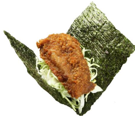
牛カツ手巻き(一貫) 250円 販売期間:4月22日(金)~

エビフライが2本入ったボリューム満点の商品。注文が入ってから店内で揚げるため、熱々サクサクの食感が味わえる。特製の出汁がきいた和風ソースとも相性抜群。