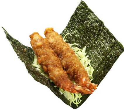
エビフライ手巻き(一貫) 250円 販売期間:4月22日(金)~

新世界の名物である串カツをイメージさせるエビフライやカツを、くら寿司ならではのシャリと合わせてご提供。