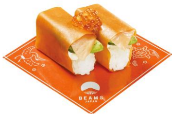
ベジロール(サーモン) 220 円