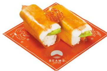
ベジロール(えび) 220 円