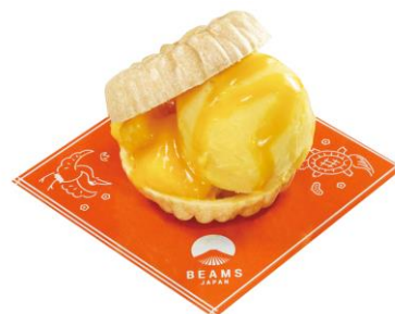
マンゴーアイスもなか 250 円

大豆を主原料とし、まるでお肉のようなジューシーさと食感が楽しめます。あっさりとした味わいで、バーベキューソースとの相性も抜群です。