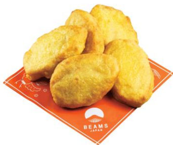
Soy ナゲット 380 円

規格外野菜を原料にした野菜シート「ベジート」(にんじんシート)を使用したロール寿司。農林水産省によると、規格外野菜の発生率は、全体生産量の約 20%になるとも言われ、食品ロス解決に向けて活用が進んでいます。商品には、脂乗りの良いサーモンとぷりぷりなエビを使用し、人気のアボカド、エビマヨ、いくらなどをトッピング。幅広い層のお客様に楽しんでいただけます。