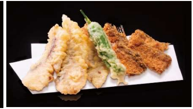
真あじ天盛り(骨せんべい付き) 600 円