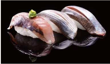
光物三貫「青の神秘」 800 円