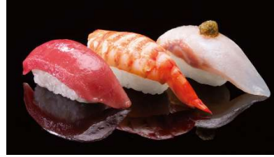
特撰三貫「銀座」 1,200 円