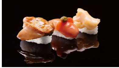
厳選貝三貫「赤の將軍」 1,200 円