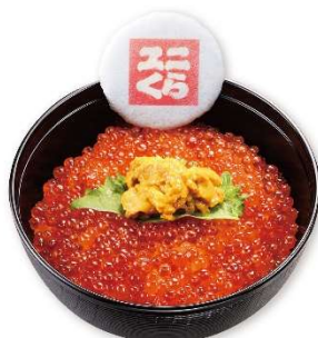
ユニくらミニ丼 980円

海苔の代わりにくら寿司名物の「ふり塩熟成まぐろ」で巻いた、今までになかった特別なファッションブルな新感覚のコラボレーションいくら軍艦。