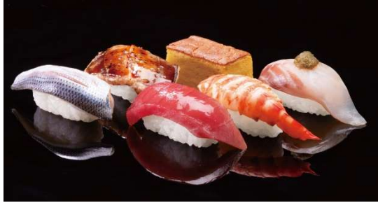
特上にぎり「蔵-KURA-」 1,800 円