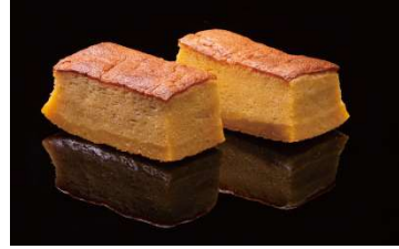
カステラ玉子焼「ふわり」 200 円