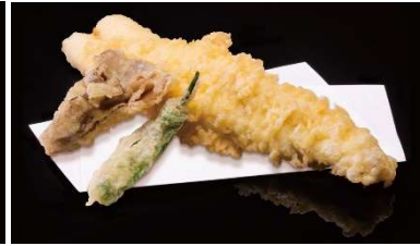
豪快穴子一本揚げ 1,000 円