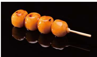
くらだんご みたらし 150 円