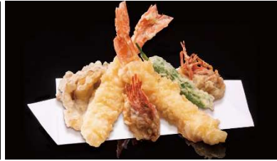
阿波の足赤海老天盛り 1,000 円