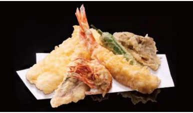
特上天ぷら盛り 1,300 円