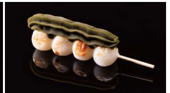
くらだんご あんこ・白あん・抹茶あん 各 200 円