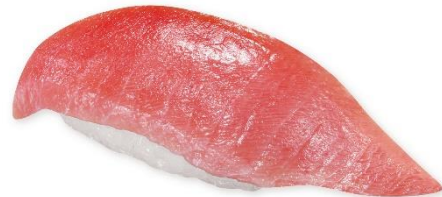
ふり塩熟成中とろ(一貫) 115 円