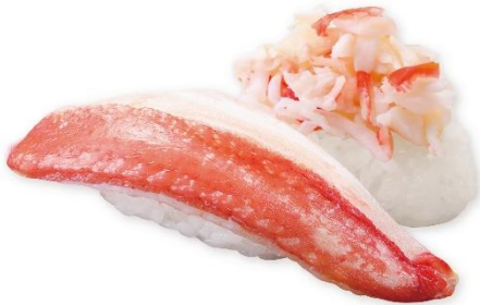
かに食べ比べ 345 円