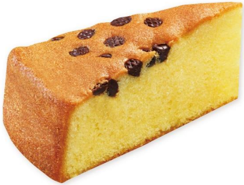
チョコチップパウンドケーキ 280円