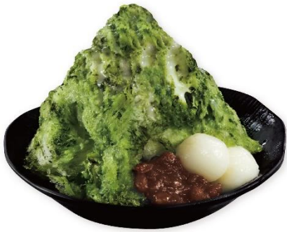
夢のふわ雪 抹茶 400円