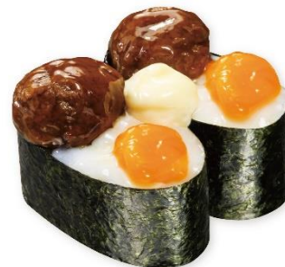
月見にくだんご 115 円