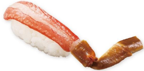
特大生ズワイガニ(一貫) 345 円