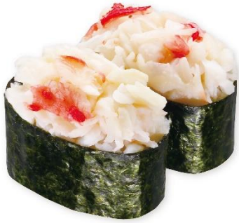
たらばかに軍艦 280 円