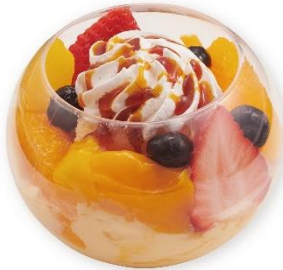
たっぷりフルーツのプリンアラモード

一人で贅沢に楽しめるホールサイズでのご提供ですが、シェアして楽しむのもおすすめです。