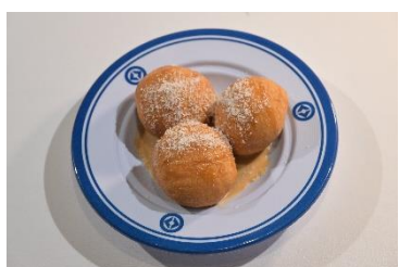
国名： トンガ王国 商品名： ケケ