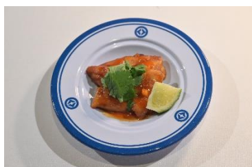
国名： タイ王国 商品名： ガイヤーン