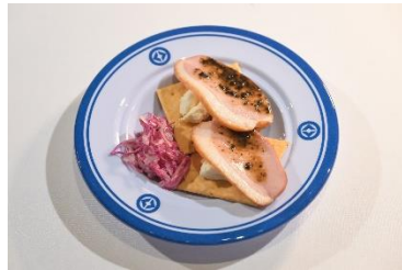
国名： ハンガリー 商品名： 鴨ロースト トリュフソース