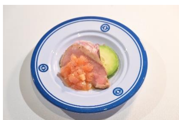
国名： ホンジュラス共和国 商品名： カルネアサード

その他の商品はこちらから確認いただけます： https://www.kurasushi.co.jp/2025expo/