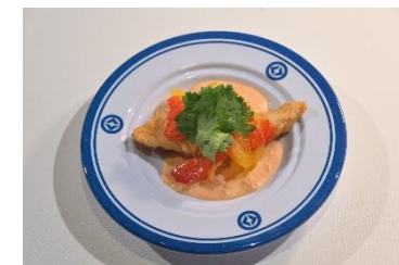
国名： ドミニカ共和国 商品名： ペスカド・コン・ココ