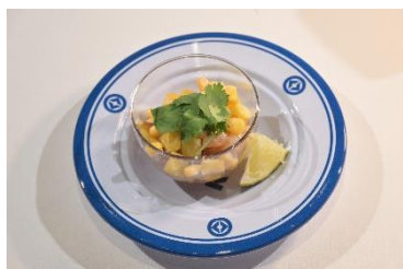
国名： ペルー共和国 商品名： セビーチェ