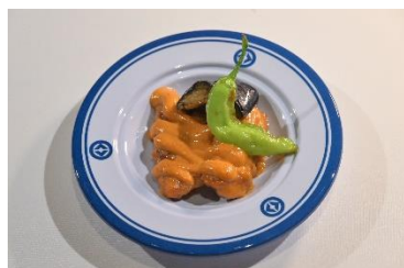
国名： トーゴ共和国 商品名： アジデジ