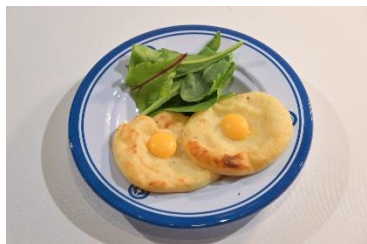
国名： アイルランド 商品名： ボックスティ