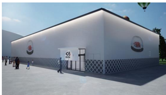
※パース画像はイメージであり、変更となる可能性があります。

この外壁素材には、廃棄予定の赤貝の貝殻約 33.6 万枚を再利用し、海藻から作る糊などを使用してできる“人工物不使用の漆喰”を採用。貝殻の処理をめぐっては、海への投棄や空き地などに積載放置されることで環境汚染につながるという問題もあり、当店舗で貝殻を再利用した「貝灰漆喰」を活用することで、大阪・関西万博の目指す「持続可能な開発目標(SDGs)達成への貢献」の一助になればと考えています。