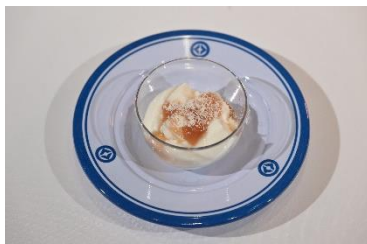
国名： イスラエル国 商品名： マラビ