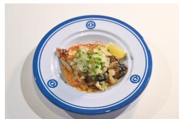
国名： カメルーン共和国 商品名： マケロ