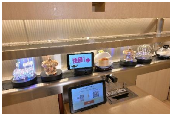
「注目！」という合図で「鮮度くん」の蓋がオープン