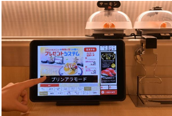
タッチパネル/スマホで注文より「プレゼントシステム」を注文

「スマホで注文」を活用することで、相手に知られずに注文するサプライズな演出も可能。また、事前の予約は不要で、その場のふとした思い付きでも気軽に利用いただけます。日頃は伝えにくい感謝の気持ちを、本システムをご活用いただき、伝えてみてはいかがでしょうか？