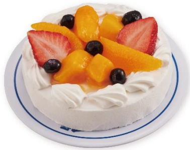
彩りフルーツケーキ