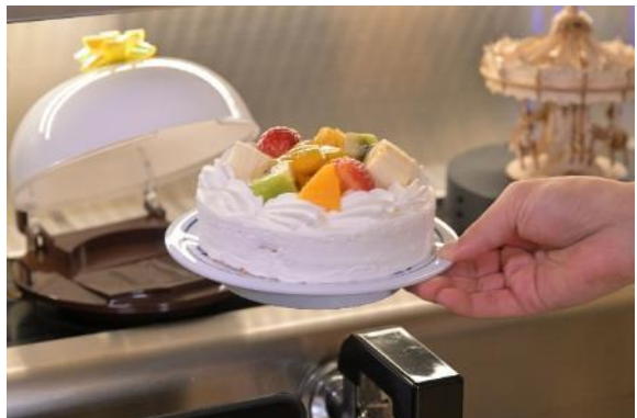
流れてしまわないうちに商品を取ってお祝い ※トッピングなど商品の使用素材は時期により異なります