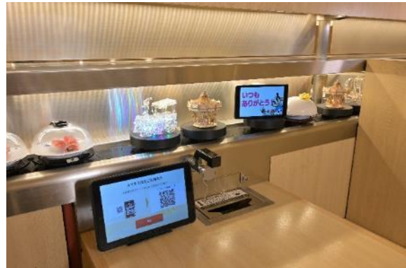
回転レーンから、パレードのように輝く装飾と特別メニューが流れてくる