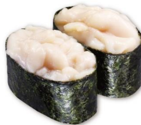
国産 白子 280円 販売期間:3月7日(金)~3月16日(日) ※数量限定