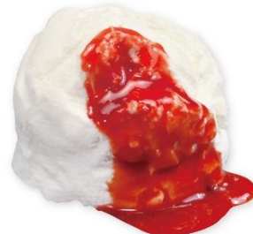
濃厚クリームダンジュ 350 円 販売期間:3月7日(金)~4月3日(木) ※お持ち帰り不可

食後のデザートに合うよう、さわやかな風味のリコッタチーズやメレンゲを使用し、軽やかな口当たりでふわふわ食感のパンケーキに仕上げました。バナナ、ホイップ、チョコレートシロップをトッピングし、チョコレートシロップの濃厚でコクのある甘みと、バナナの自然で優しい甘さがマッチします。