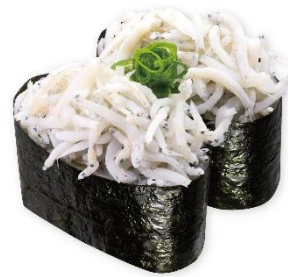
【愛媛県産】釜揚げしらす 115円 販売期間:3月7日(金)~3月30日(日)