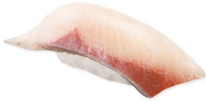
【愛媛県産】みかんぶり(一貫) 150円 販売期間:3月7日(金)~3月30日(日)