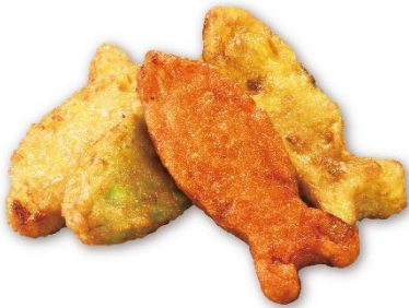
おさかなげつと 190 円 販売期間:3月7日(金)~4月3日(木)

タラのすり身をベースに、真鯛の落とし身も使用。原料を混ぜる時間を調整し、柔らかくふわふわな食感に仕上げました。カラフルな魚の形がかわいらしく、緑は枝豆、赤は人参、黄はコーンを使用。甘みがあり、野菜が苦手な方でも食べやすい一品です。