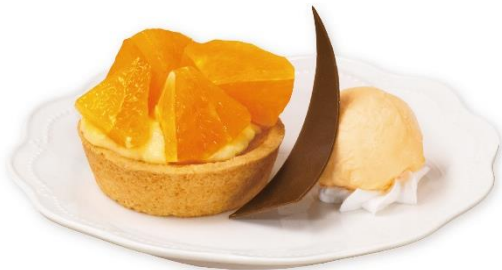
【愛媛県産】清見オレンジタルト 680 円 販売期間:3月7日(金)~4月3日(木)

※お持ち帰り不可 ※各店舗1日数量限定 ※「グローバル旗艦店原宿」ではお取り扱いしておりません