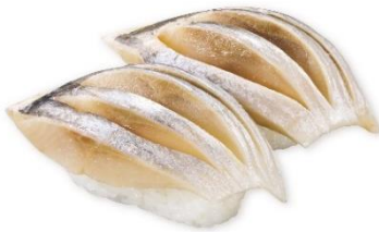
【北海道産】とろにしん 115円 販売期間:3月7日(金)~3月16日(日) ※北海道原料使用・数量限定