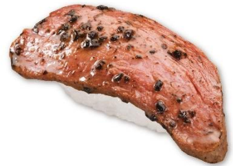
ローストビーフ 黒トリュフソース(一貫) 230円 販売期間:3月7日(金)~3月30日(日)

一般的なニシンの3倍以上の脂質を持つ原料を選定。酢締めする際に、酢の濃度や漬け込み時間を細かく調整することで、ニシンの旨みをより引き出しました。サイズも大きく、食べ応え抜群で、ニシンの脂の旨みと甘みが口いっぱい広がります。