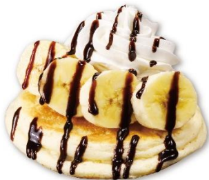
チョコバナナパンケーキ 250 円 販売期間:3月7日(金)~ ※お持ち帰り不可

食後のデザートに合うよう、さわやかな風味のリコッタチーズやメレンゲを使用し、軽やかな口当たりでふわふわ食感のパンケーキに仕上げました。バナナ、ホイップ、チョコレートシロップをトッピングし、チョコレートシロップの濃厚でコクのある甘みと、バナナの自然で優しい甘さがマッチします。