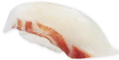
【愛媛県産】みかん真鯛(一貫) 170円 販売期間:3月7日(金)~3月16日(日)