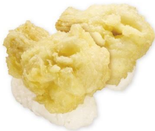
【愛媛県産】はも天にぎり 230円 販売期間:3月7日(金)~3月16日(日)