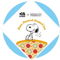
包み紙はスヌーピーの イラスト入り

スヌーピーのミニピザまん 250 円 販売期間:6月26日(金)~8月5日(水) ※お持ち帰り不可