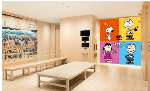
《グローバル旗艦店 なんばパークスサウス》