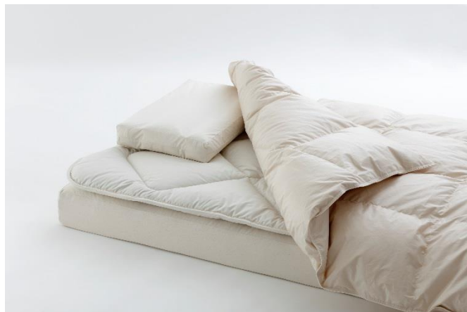
自然が育んだ素材を活かしました