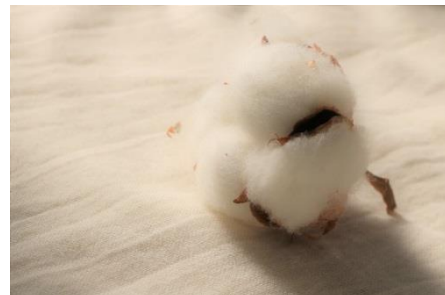
無漂白・無染色の素材だけで作った寝具

日本では古来より、人と自然との調和が重んじられてきました。健やかに命を紡いでいく知恵として、水や空気、動植物がもたらす資源を大切に使ってきたのです。今、私たちは再び原点に立ち戻り、ものづくりを見直したいと考えています。現実の壁は阻まれて実現に至っていない構想もあります。サステナビリティへの取り組みは終わりのない旅路。unbleachedという新たな一歩を、次の行動につなげています。