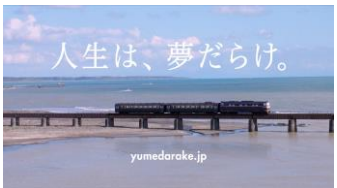
(滝藤さん) 「人生は、夢だらけさ。」 (タイトル) 人生は、夢だらけ。