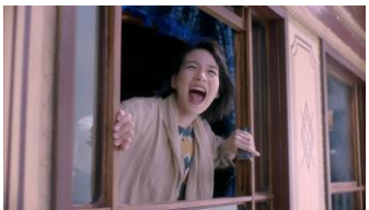
(滝藤さん) 「日本中を歩きなさい。」