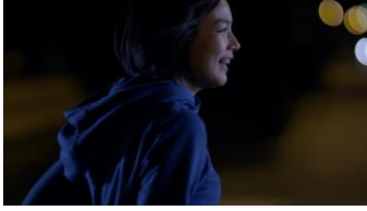
(能年さん) 「そしたら、」