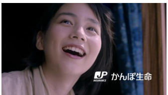
(能年さん) 「かんぼ生命」 (ロゴ) かんぼ生命