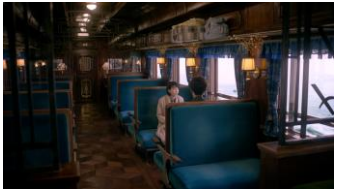
(能年さん) 「視界がきっと開けるから。」