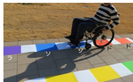
図2. 車いす利用者に配慮したアクセシブルデザイン

本研究では、都産技研のもつ静電植毛技術と首都大が有するデザイン基盤技術を融合させ、誰でも認識しやすい色を音に変換するモジュールを開発します。このモジュールを搭載した車いすを用いて、カラフルなトレーニング場で、色や音を楽しみながら操作を学ぶことで、車いす訓練や障がい者スポーツの促進に貢献していきます。