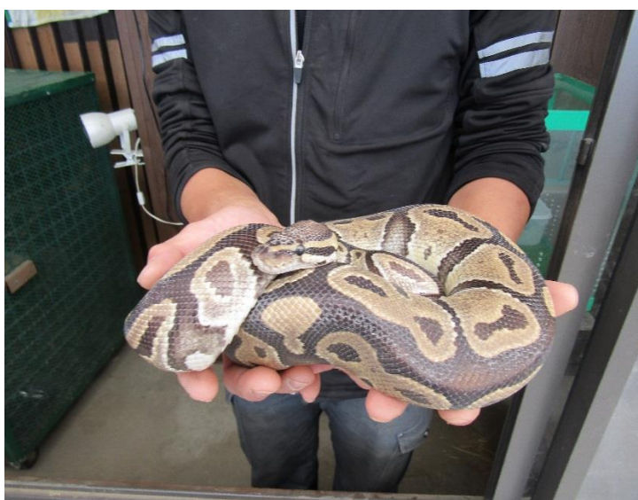
【蛇とのふれあい撮影会】