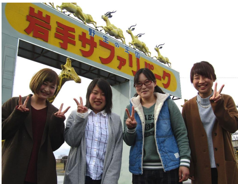
【岩手サファリパーク入場口前】