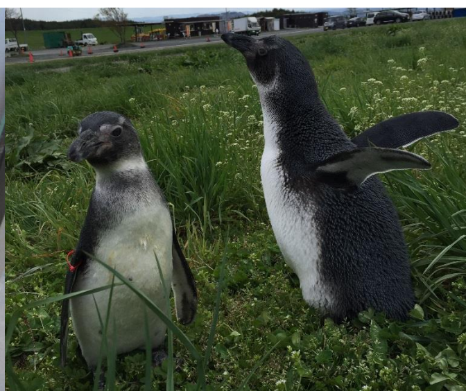
【ケープペンギンのお散歩タイム】