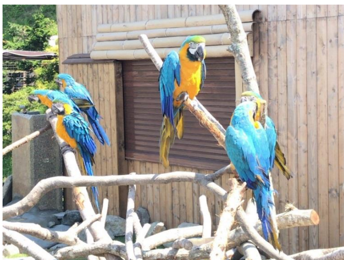
【ルリコンゴウインコの展示】