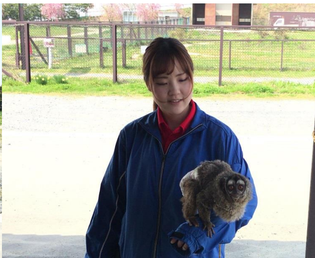
【ヨザル・ペンギンのお散歩タイム】