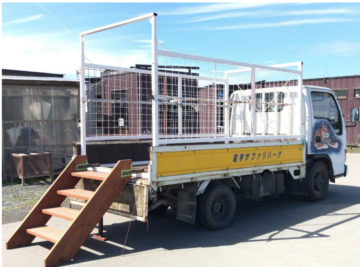
【初開催のわくわくアドベンチャーツアー専用車全景】

期間中の7月14日(土)、7月15日(日)、7月16日(月)及び7月21日(土)、7月22日(日)、7月28日(土)、7月29日(日)の7日間限定で、岩手サファリパークオリジナルサマーグッズをご来園のお子様限りプレゼント！ (無くなり次第終了します。)