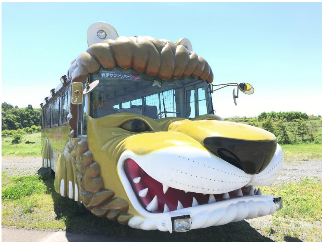
【岩手サファリ飼育員バスガイドツアーイメージ】