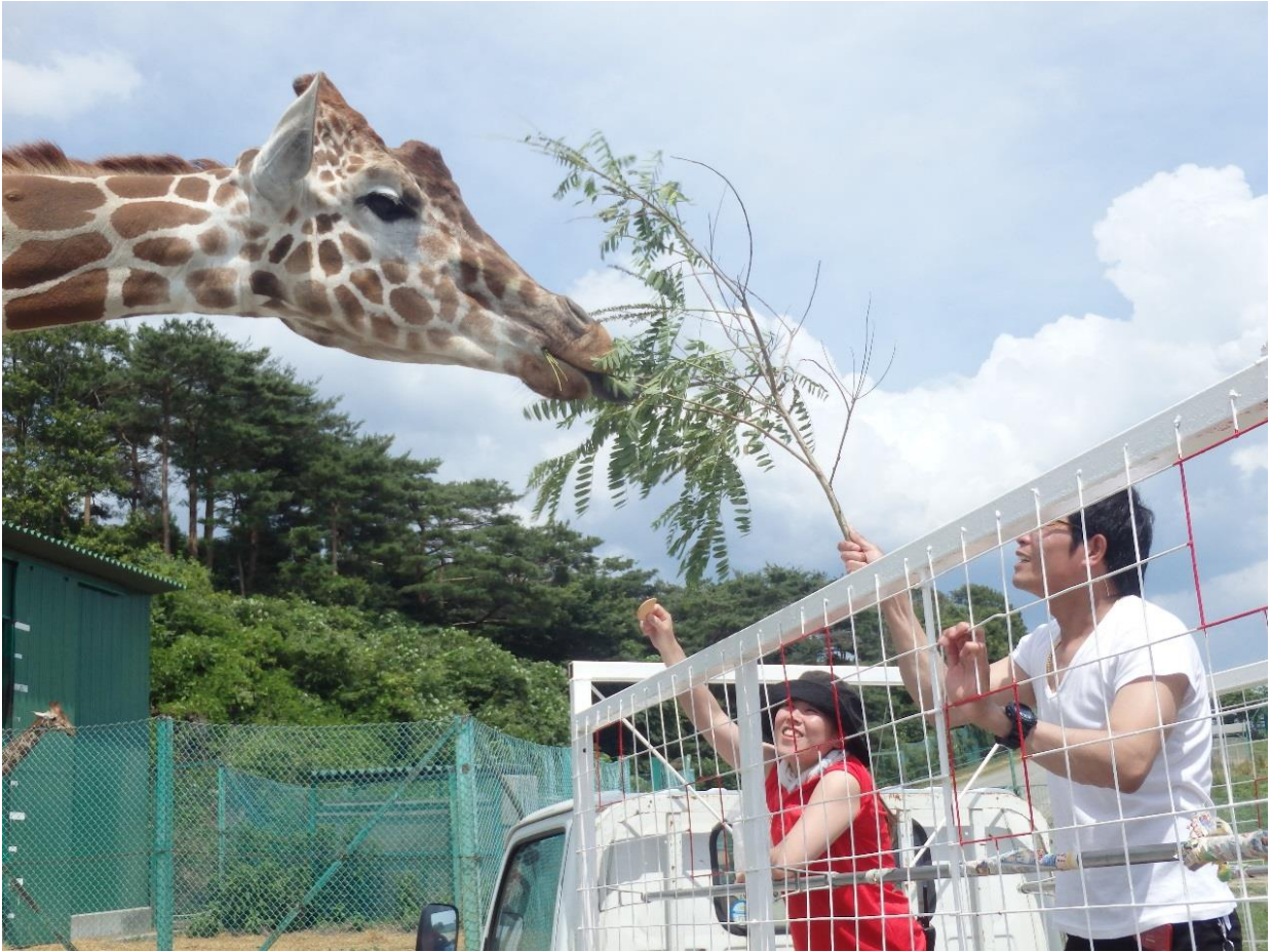
【人が檻の中? わくわくアドベンチャーツアーイメージ】