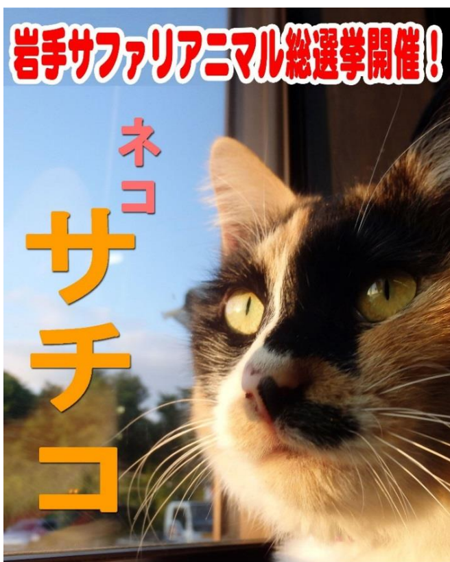
【岩手サファリアニマル総選挙開催】