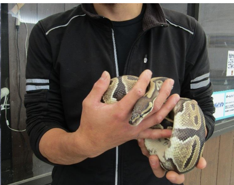
【蛇のふれあい撮影会】