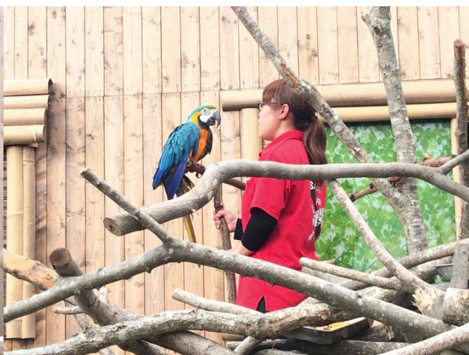
【キーパーズトーク】