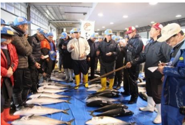
魚のまち「氷見」の氷見漁港での競りの様子

報道機関の皆さまには、ご多用中、突然のご案内で恐れ入りますが、ぜひご来場・ご取材を賜りたくお願い申し上げます。当日、今後の寒ぶり取材に関しましてもご相談を承ります。