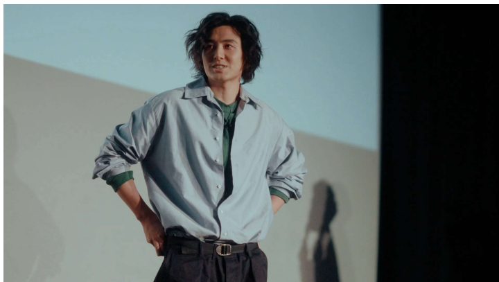
総括ムービーより

株式会社NTTドコモは、何かに挑戦したい意志を持っていても、きっかけや手段がなく、一步を踏み出せずにいる学生が、制限なく自らの可能性に挑戦できるように後押ししたいという思いから2022年4月に始まった「KAZE FILMS docomo future project」のプロジェクトを振り返る総括ムービーを、12月27日（火）より特設サイトにて公開いたします。