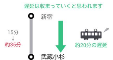
図1. 乗換案内アプリ画面例