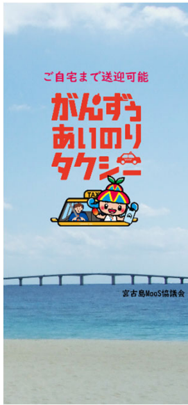
▲アプリトップ画面