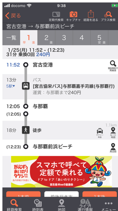
「乗換案内」アプリバナー