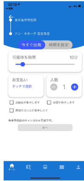
▲乗車時間・チケットなどを選択