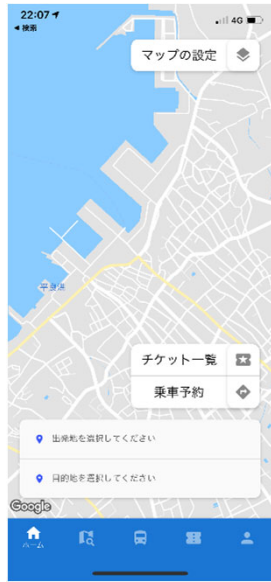
▲乗車場所と降車場所の指定