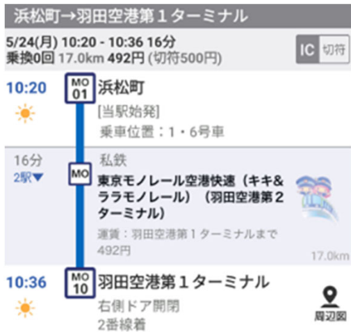
経路検索結果の表示