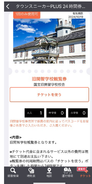
旧開智学校観覧券引換画面