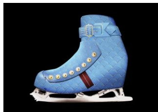
世界で唯一のスケートシューズ

1985年東京都生まれ。東京藝術大学で染織を専攻し、遊女に関する文化研究とともに友禅染を用いた着物や下駄を制作。近年は、アーティストとして展覧会を開催するほか、伝統工芸士との創作活動にも精力的に取り組む。