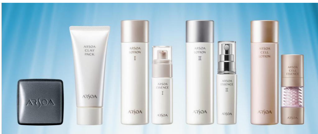
「アルソア スキンケア」新製品

アルソアは、「アルソア スキンケア」新製品を通じ、肌本来のチカラを活かし、その人本来の美しさを引き出す製品をお届けしてまいります。