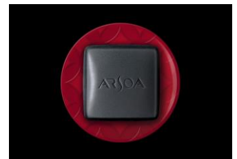
オリジナルソーフトレイ