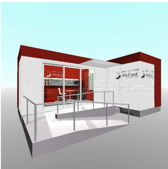
「CUBE Minny」2戸を組合せたタイプの「My Foot Station MINI」の外観

今回は、グループ会社であるDGPとのコラボレーションにより、「My Foot Station MINI（マイフットステーションミニ）」をコンセプトモデルとして開発し、義肢装具士などの専門職、新規事業を進めたい靴小売店に対して提案を行っていく。DGPは「マイフットステーション銀座店」で提供するサービスを、「CUBE Minny」に3次元足形計測機や足底圧計測システム「footscan」などを「My Foot Station MINI」に搭載し、コンテナサイズのスペースでも提供できるようにしている。インソール切削機も搭載すれば、接客からインソール設計および製作をワンストップで実現したという義肢装具士やインソールショップなどの施主の要望にもこたえることが出来る。DGPとして、事業再構築補助金やものづくり補助金を利用した新規事業を立ち上げたい企業を中心に需要を見込んでいる。