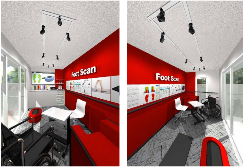
「My Foot Station MINI」の内観