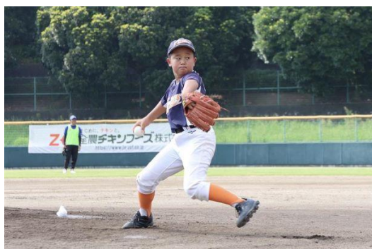
一打席対決でピッチャーを務めた選手