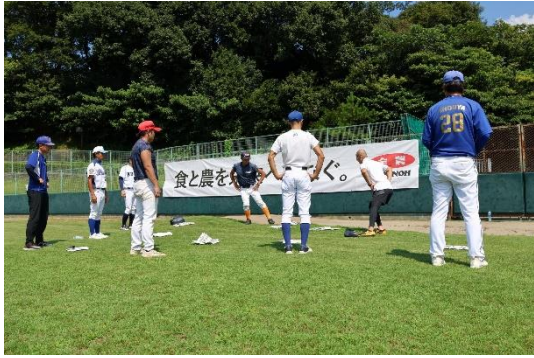
指導者向け講習会