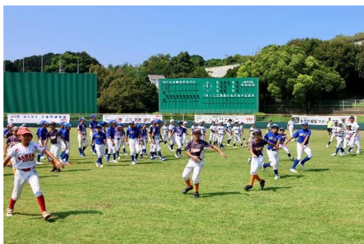
ウォーミングアップをする子どもたち

野球教室の最後には講師から推薦された選手が対決する一打席対決を行い、代打として出場した真中講師との対決に選手たちは大変盛り上がりました。また、サインボールをかけたじゃんけん大会が行われるなど、内容の濃い1日となりました。