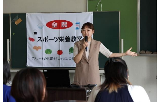
保護者向けスポーツ栄養教室

また参加者に、JA静岡経済連よりみかん日和（みかんジュース）、協賛各社からは国産農畜産物を使用した加工品などを提供しました。