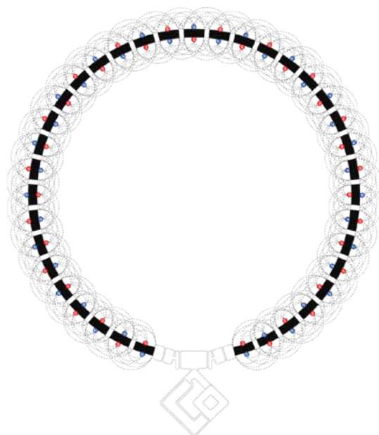
【磁石配置 イメージ図】