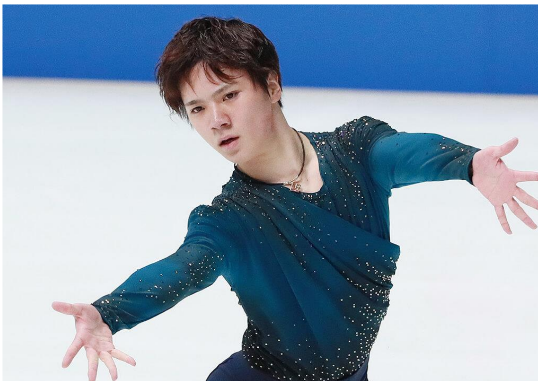
2018-2019 シーズンの宇野昌磨選手の衣装をイメージした「シャンパンゴールド×パープルラメ」が商品化。 ペンダントトップ裏に「SHOMA 2019」の刻印が入った数量限定モデルです。

「コラントツテ TAO ネックレス スリム AURA mini【SHOMA2019】」の発売を記念し、宇野昌磨選手をお迎えしてイベントの開催と購入者様限定の「宇野昌磨選手 応援キャンペーン “夢を一緒に”」を実施いたします。