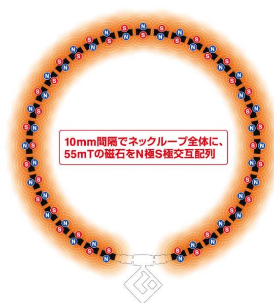
磁石配置イメージ図