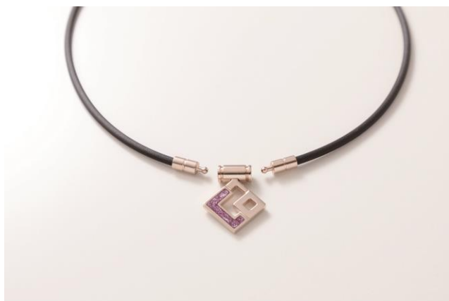
正面/ジョイント部