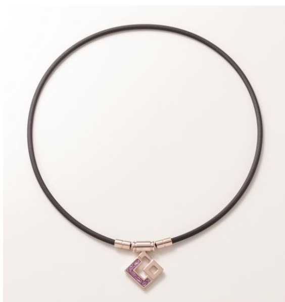
シャンパンゴールド×パープルラメ