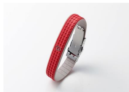
ガーネットレッド