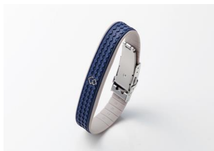
アビスサルブルー