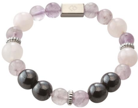
ローズクォーツ×ラベンダーアメジスト