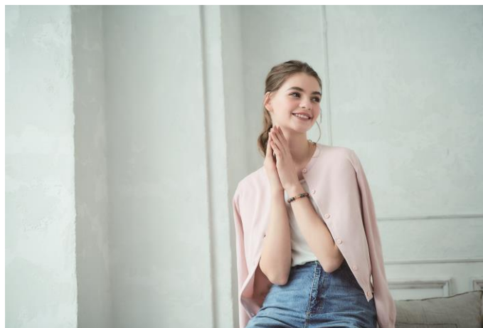
女性着用イメージ