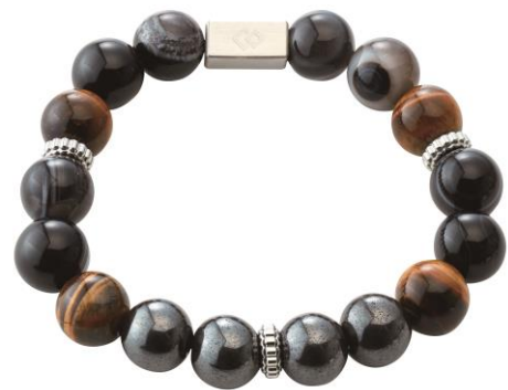
タイガーアイ×天眼石