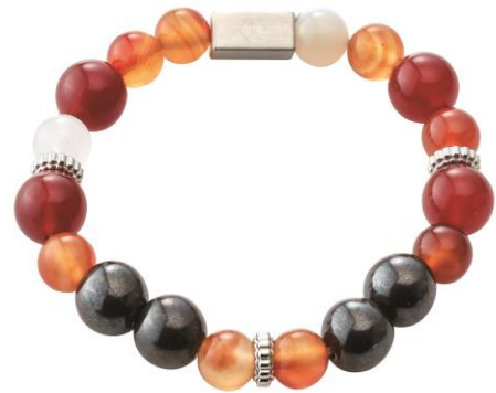
赤メノウ×カーネリアン