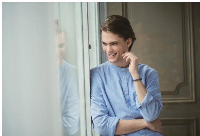
男性着用イメージ