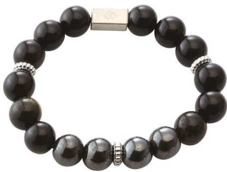
ゴールデンオブシディアン