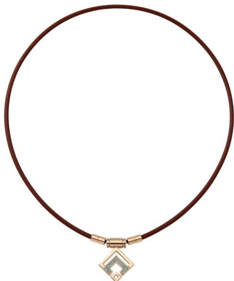
シャンパンゴールド×スノーブルーラメ