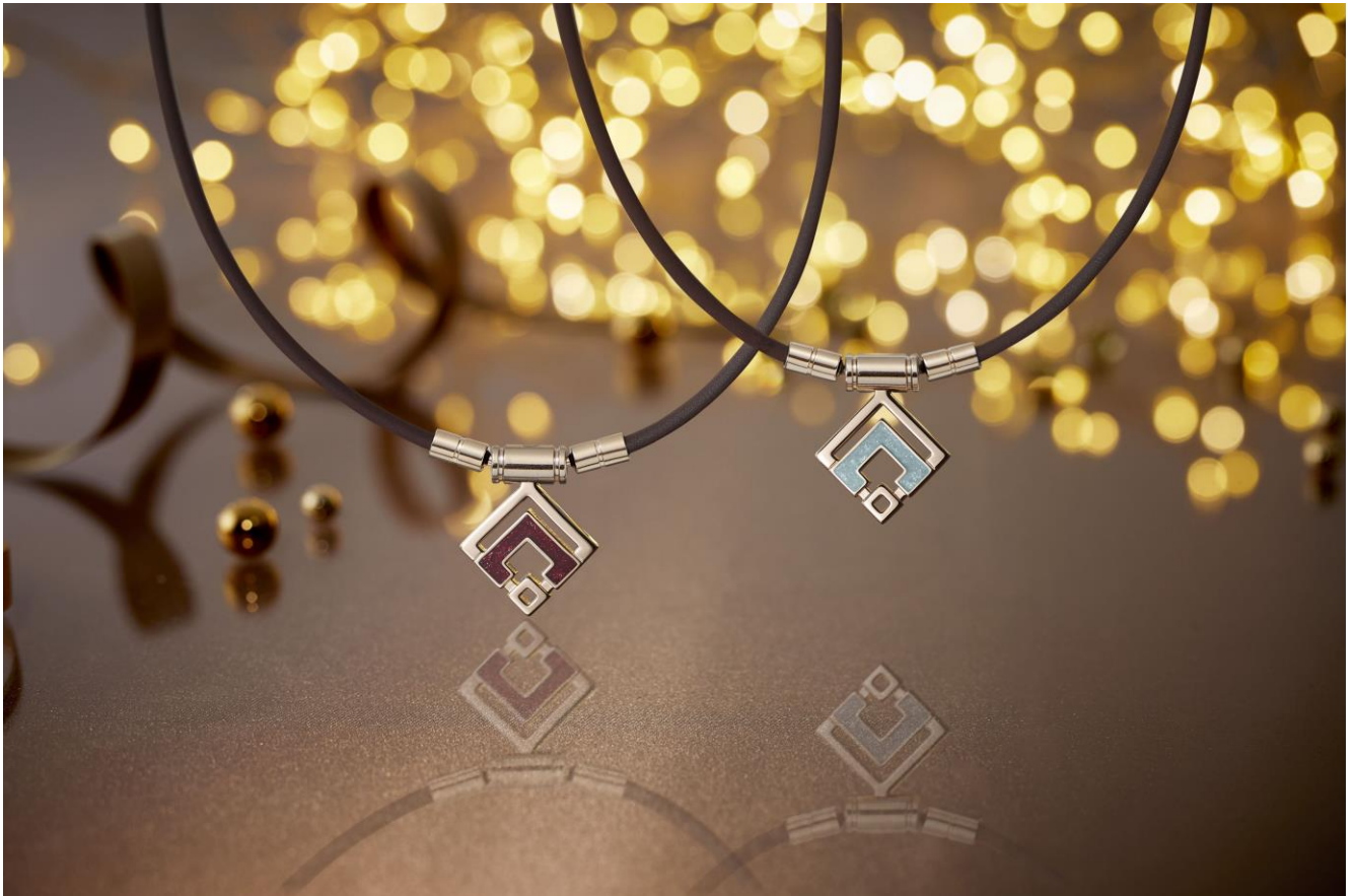
「TAO ネックレス スリム ARAN mini【BR】」 価格¥22,000/税抜 写真左<シャンパンゴールド×ルビーレッドラメ>写真右<シャンパンゴールド×スノーブルーラメ>