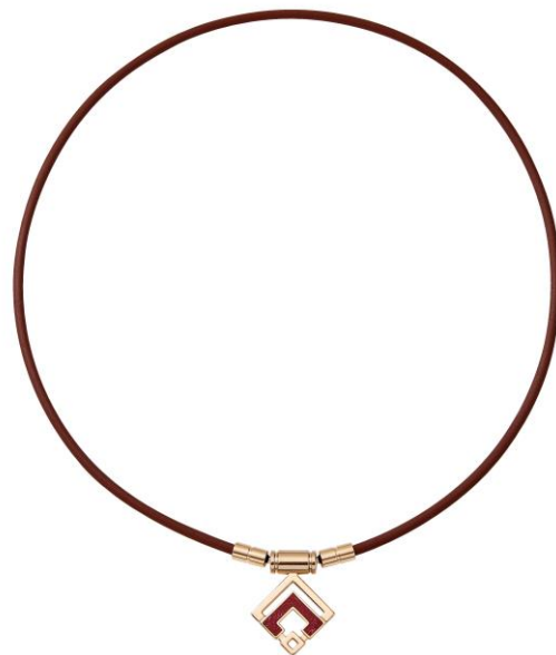
シャンパンゴールド×ルビーレッドラメ