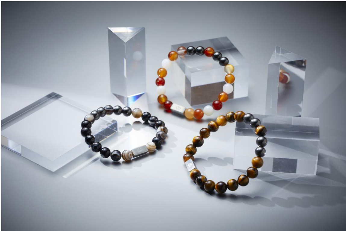
コラントツテ ループ REI 価格¥7,480/税込 写真左<天眼石> 写真中央<カーネリアン> 写真右<タイガーアイ>

磁気健康ギア「Colantotte (コラントツテ)」の製造・販売元である株式会社コラントツテ (本社：大阪市中央区、代表取締役社長：小松 克己) は、数珠タイプの腕用磁気アクセサリー「コラントツテ ループ REI (レイ)」(価格¥7,480/税込) を、大手家電量販店、大手スポーツ量販店、バラエティショップ及び WEB ショップで販売いたします。(本製品はコラントツテオフィシャルショップ、オフィシャルサイトにて取り扱いはございません。)