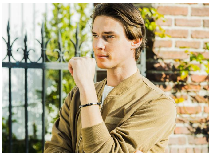
男性着用イメージ