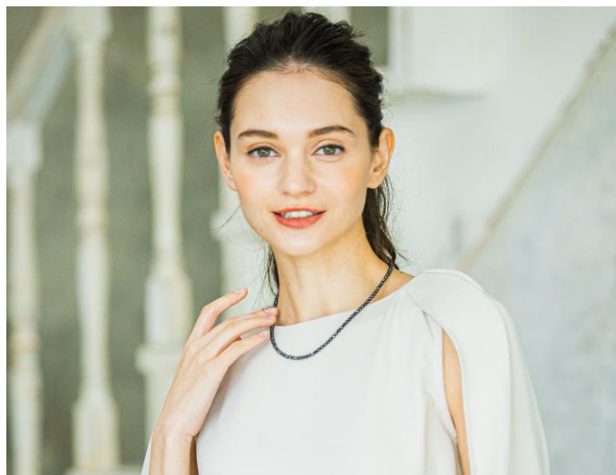
女性着用イメージ