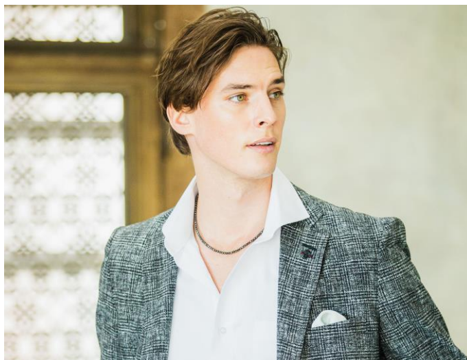
男性着用イメージ