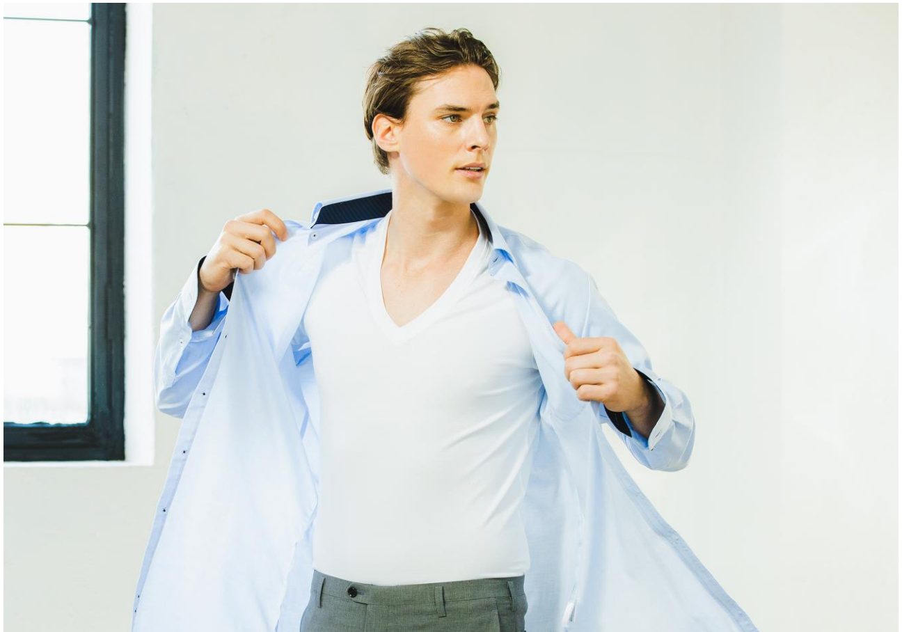
コラントツテ レスノ マグケアシャツ Vネック T 価格¥3,960/税込

磁気健康ギア「Colantotte（コラントツテ）」の製造・販売元である株式会社コラントツテ（本社：大阪市中央区、代表取締役社長：小松 克己）は、～今日の疲れをケアして、ベストな明日をつくる～をコンセプトに掲げたブランド Colantotte RESNO から着るだけでボディケアできるインナーシャツ「コラントツテ レスノ マグケアシャツ Vネック T」（価格¥3,960/税込）を2021年4月28日より順次販売いたします。